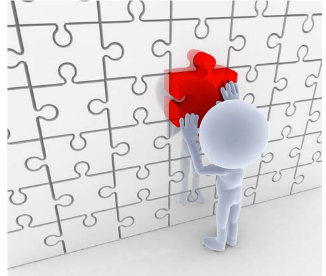
Equipo: Analistas de intermediación laboral